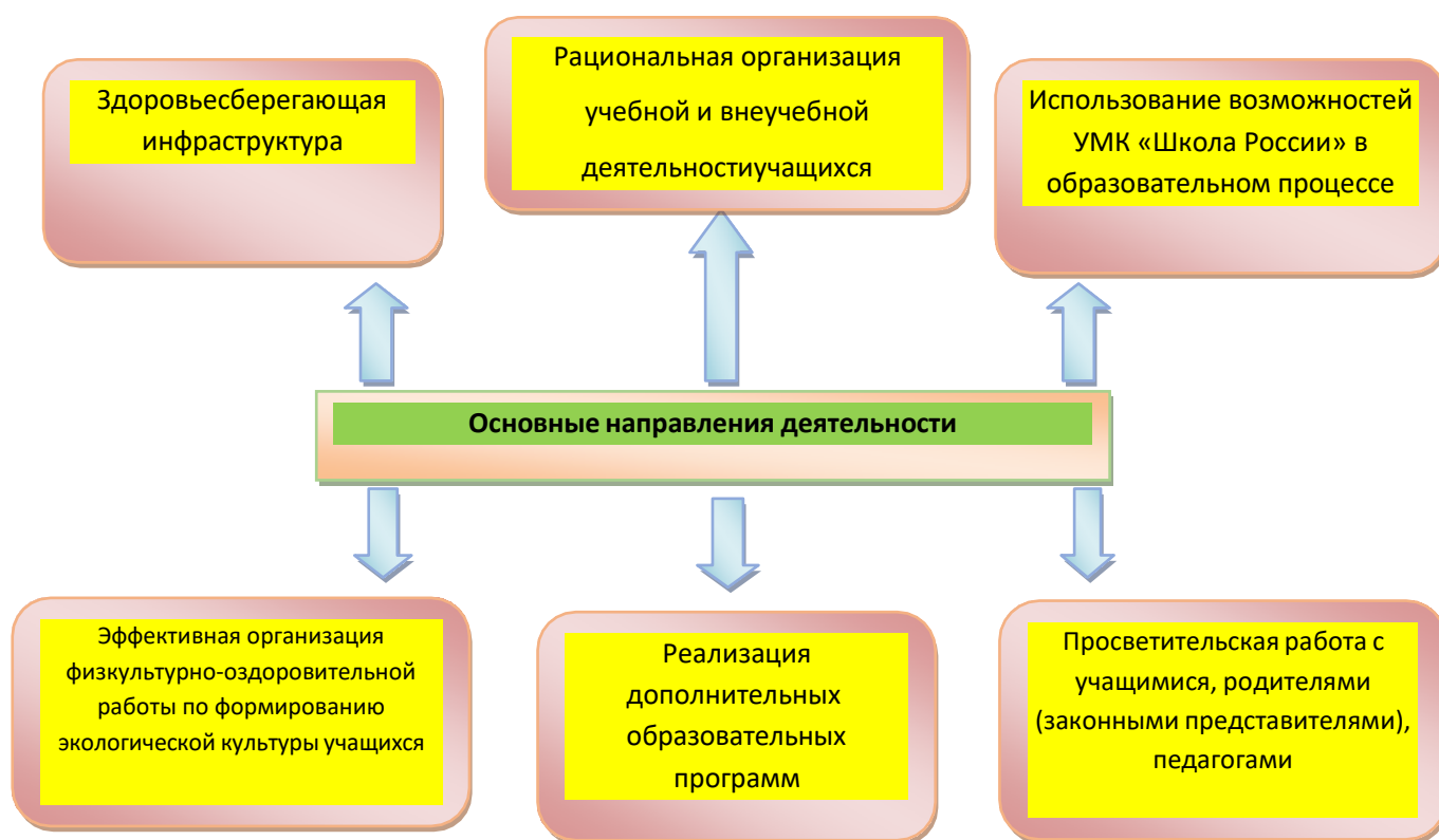
Рис. Основные направления деятельности в рамках ЗОЖ

Работа по формированию экологической культуры, здорового и безопасного образа жизни на уровне начального общего образования ведется по направлениям: